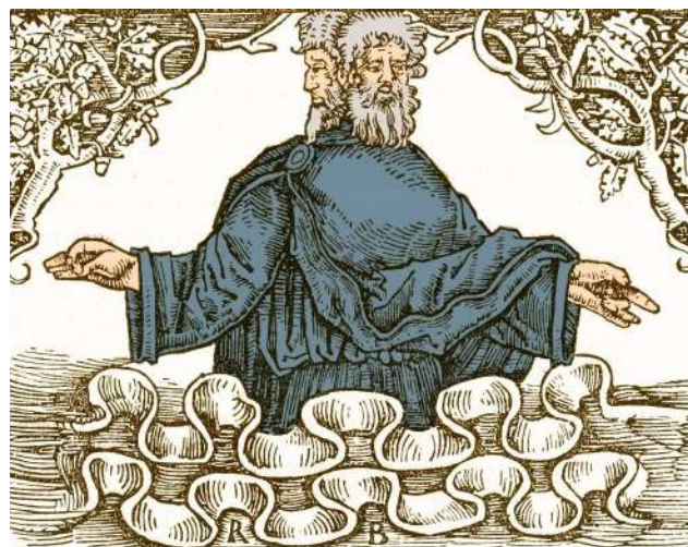
January, from latin "ianua" meaning door. Janus was the god of transitions, the beginning and the end, looking to the past and the future with his two faces.