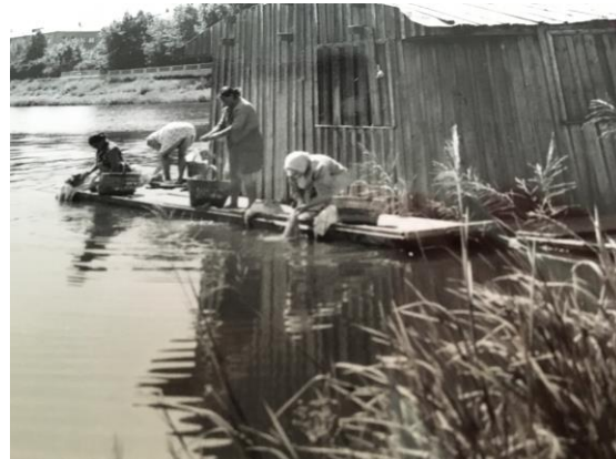
Women in Suzdal, then the Soviet Union, washing clothes in the river, 1972

Washing clothes in natural streams are still used in many places in the world, where there are no washing installations and no regulated water supply. The women, for the laundry workers were and are most often women, will be standing in the water or kneeling on a bridge, dipping the clothes in the water. I shudder to think how cold that must be, and also at the threat of the water-borne parasites that are rampant in many places of the world.