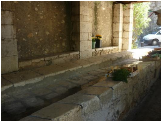
Lavoir in St. Paul de Vence, Provence

It is not clear to me when the public wash-houses disappeared. What I do know is that during my childhood my grandmother heated water and clothes in a large copper kettle. She next lifted the wet, soapy clothes into a so-called washing machine, which was not a machine at all, as it was a hand-operated cradle wash designed to move the clothes around in the water, making the process easier than scrubbing on a washing-board. Next the clothes had to be rinsed, but I never witnessed that part of the process. My grandmother and the other housewives presumably had to lift the water from the pump into the kettle and then later into whatever tub they used for rinsing the clothes.