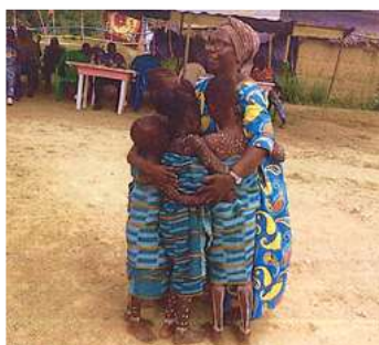
Fondatrice de l'association et de l'école

S’est greffé sur l’école, tout naturellement et nécessairement, le projet d’une infirmerie née dans l’urgence à cause et grâce à la pandémie de Covid 19. Elle a été créée, construite en un temps record. Cette infirmerie est en outre un nouvel apport, un nouvel élan pour le développement du village que Femmes d’Europe a soutenu avec enthousiasme.