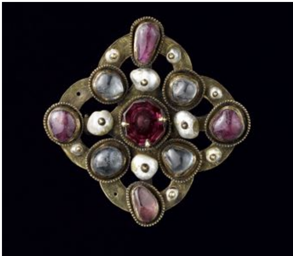
Broche en argent doré, saphirs, rubis, grenats et perles issues du trésor de Colmar

Dès le Moyen-Age, apparaissent aussi toutes les nuances du grenat venant alors du Sri Lanka et d'Inde ainsi que le rubis d'un rouge profond et l' améthyste avec sa brillance violette.