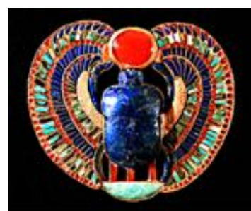
Pectoral de Toutankhamon

Par le pectoral égyptien avec le scarabée (kheper) cerclé d'or en lapis lazuli (bleu comme l'œil d'Horus), nous analysons les aspects et origines de la cornaline avec ses nuances de jaune qui symbolise le soleil, la turquoise pure ou nervurée et sa variante plus verte : l'amazonite.