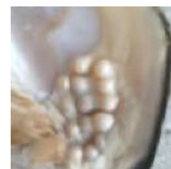
Formation des perles

Nous apprenons comment les perles se forment : soit par auto-défense de l'huître lorsqu'un corps étranger s'insère dans la coquille, qu'il s'agisse d'une poussière ou d'un grain de sable (perles fines), soit en ouvrant de 2-3 cm la coquille et introduisant par incision un nucleus dans la gonade que l'huître, pour se défendre, entoure de nacre (perles de culture comme en Polynésie).