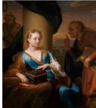
Godfried Schalcken, The useless moral lesson, circa 1680/84, The Hague Mauritshuis

Everyone knows the paintings with merry companies in which there is dancing, music making, wine drinking and flirtation. This genre was extremely popular in the seventeenth century. But is this just about entertainment or is there more to it? What does the fool do in the midst of the party and why are these young people dressed so flamboyant? The popular emblem books are an important source for their interpretation. These are picture books in which a certain concept is explained on the basis of an image. Apparently everyday situations and objects are given a symbolic explanation. It is not surprising that this explanation is moralizing. The underlying message is: having fun is allowed, but beware of the dangers. Especially the young suitors and their loved ones have to be careful! Humour goes hand in hand with morality, learning and entertainment. This lecture is about the slippery path of love, marriage (watch out for women wearing the trousers), the unequal couple and old age.