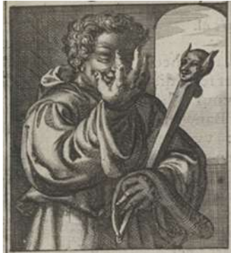
The fool in Roemer Visscher, Sinnepoppen, 1614